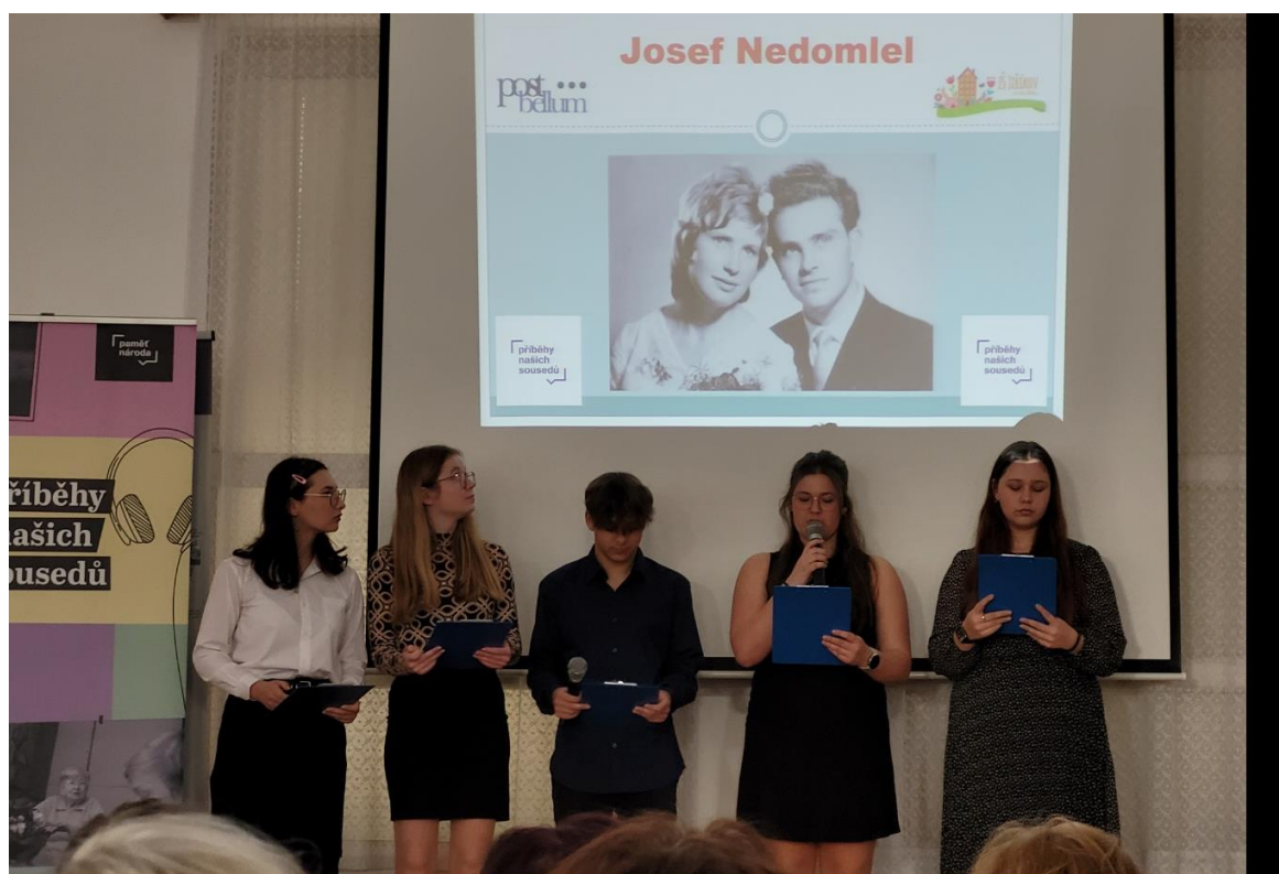
Autorský tým ve školním roce 2023-2024