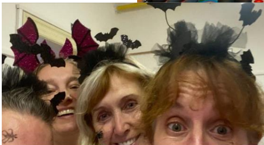
I my jsme se ve školní jídelně halloweensky vyřádily 😊, kuchařky ŠJ Jiříkov