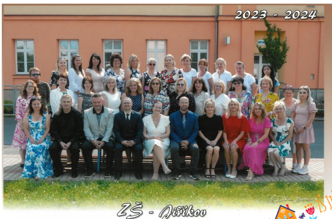
Učitelský sbor ve školním roce 2023–2024