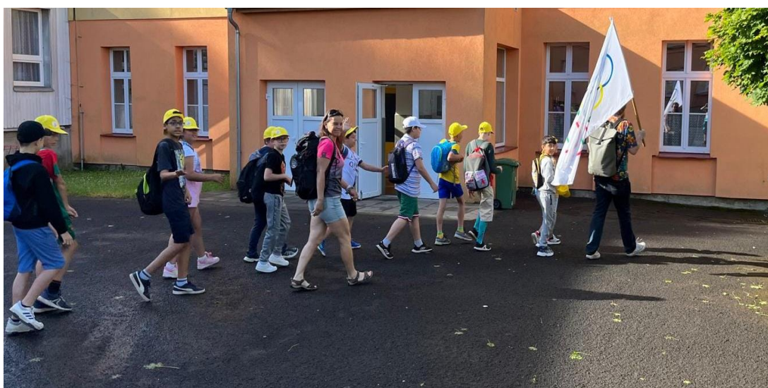
Začátek školní olympiády